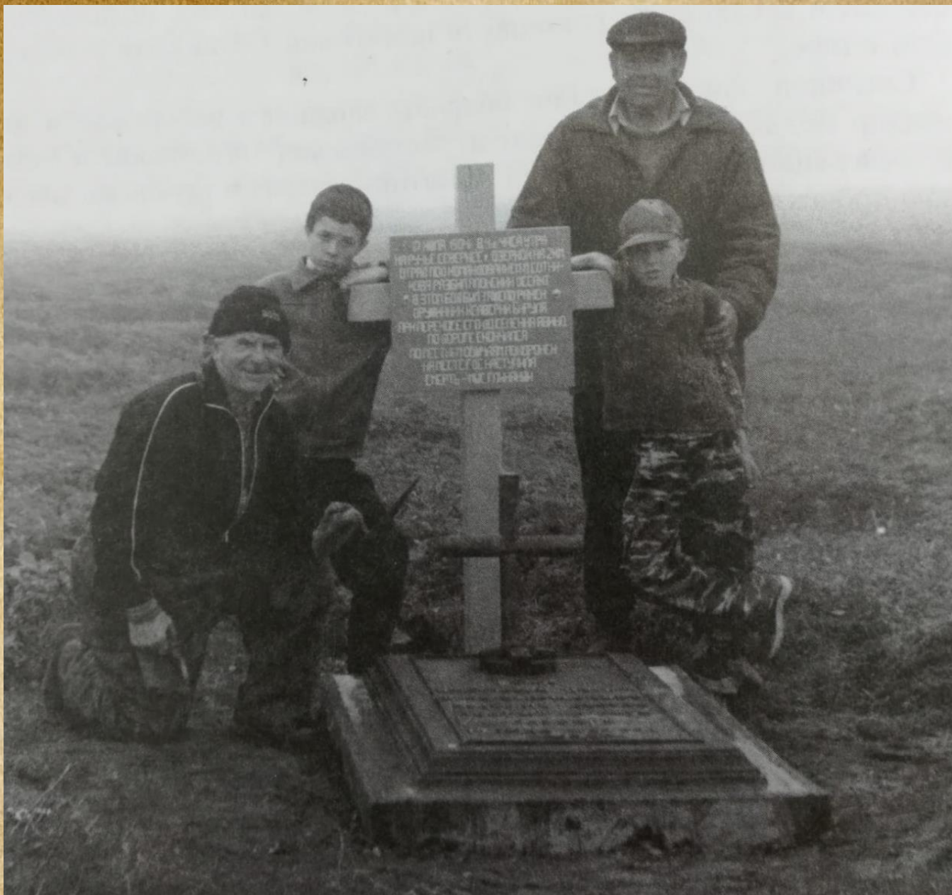
Могила героя обороны — дружинника Ксаверия Бериули